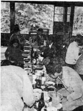
そばと山菜の味 関川にて