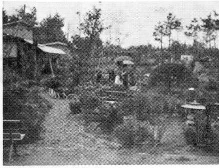
さつきの如く 大山農場にて