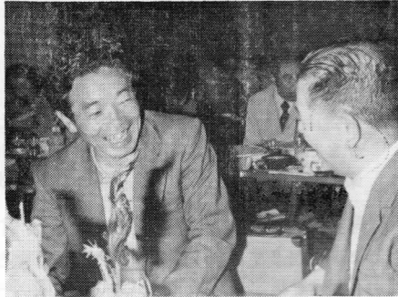
ご満悦の新旧会長さん 関川にて