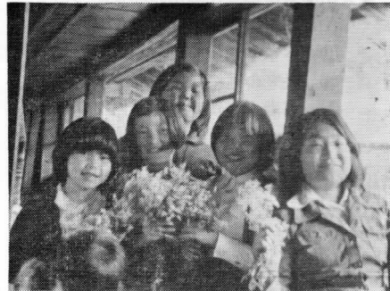
花のお嬢さん 関川にて