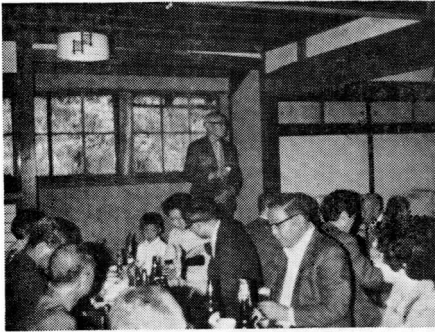
長老の乾杯 関川、金沢屋にて