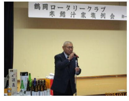
東京東江戸川ロータリークラブ様 会津若松南ロータリークラブ様よりお土産を頂きました