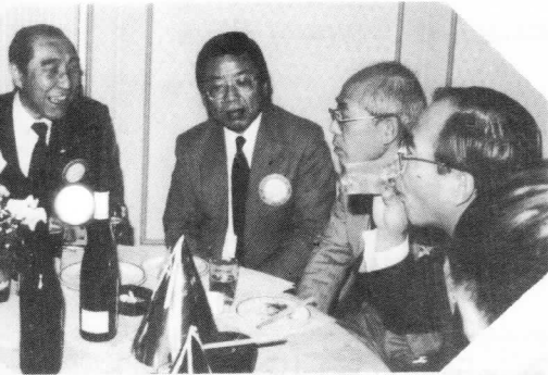
むずかしい話かな？