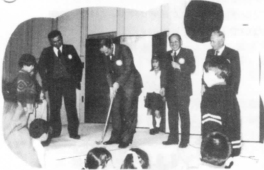
フルーツゴルフ大会 一番上手な人は？