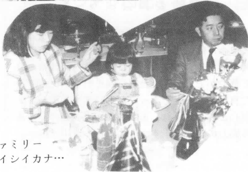
しあわせファミリー オイシイカナ...