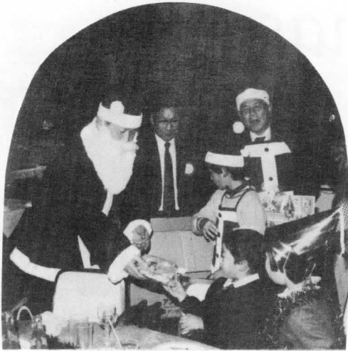
良い子にサンタのプレゼント