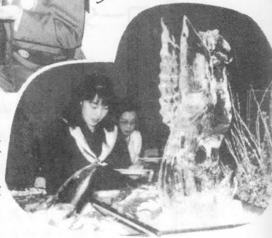
みごとな... 水の彫刻