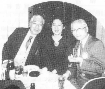
美人を囲む ヘンナオジサン