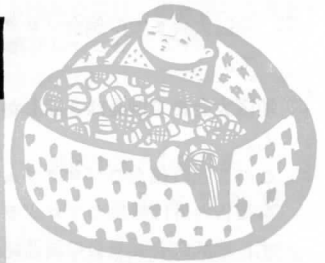
郷土の民芸品 いづめこ人形