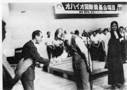
鶴岡市長にハイオ合唱団から、鶴岡市民におくりもの交換スナッフ