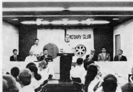
フレージャー団長