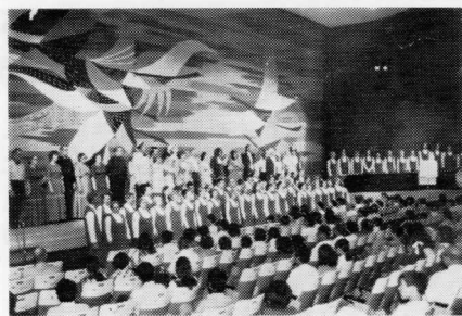
「世界は二人のために」合唱団フィナーレの演奏