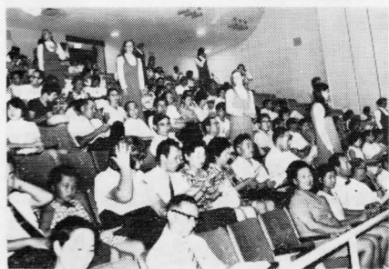
観客と合唱団がとけ合って、国際親善スナッフ